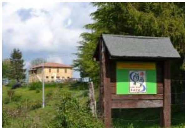
CASALE S. ANNA

Alcune criticità presenti nel Casale, strada di accesso non agevole, mancanza di acqua potabile e di corrente elettrica oltre la necessità