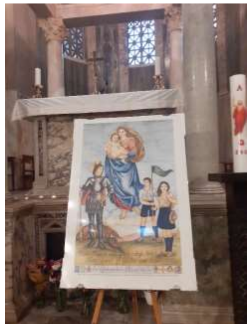
Comunità RM 9