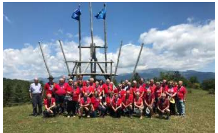
PARTECIPANTI AD UN CAMPO MASCI

Molti dei lavori per rendere fruibile la base, sono stati frutto dell'impegno di numerosi A.S. sia del Lazio che di altre regioni italiane. Non di rado fratelli e sorelle del MASCI che venivano alla Base in occasione di eventi nazionali, hanno trascorso qualche giorno in più per portare il loro contributo. Si stima che il monte ore di lavoro sostenuto da molti AS