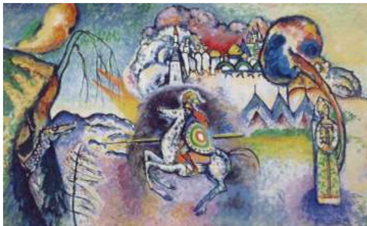
"KANDINSKIJ, IL CAVALIERE ERRANTE"