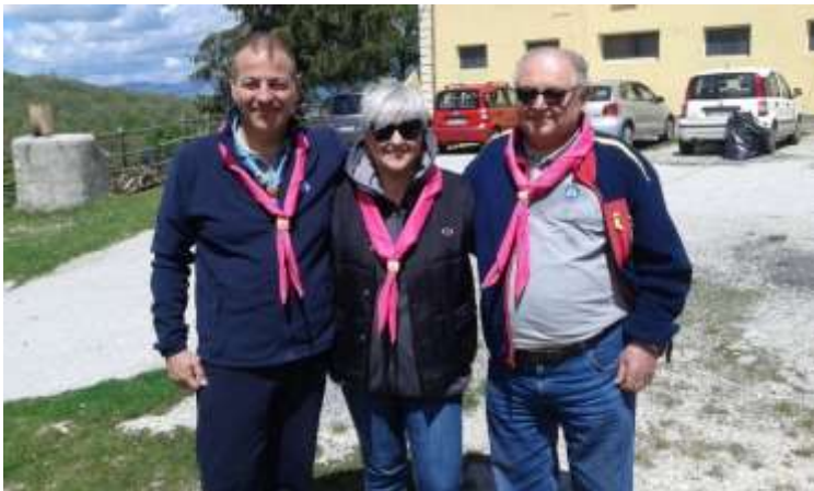
SCOIATTOLI DI SALA

Con gli anni, si è sedimentato un piccolo gruppo di A.S. del Lazio (12/15 persone), che hanno fatto proprio l'impegno della manutenzione e della gestione della Base, e più o meno mensilmente si ritrovano a S. Anna nel fine settimana. Questi A.S. si definiscono